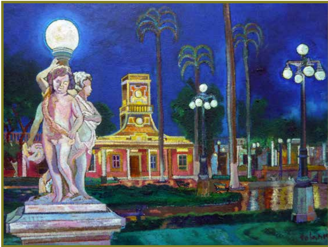
Parque de Barranco. Enrique Polanco. https://www.facebook.com/enriquepolancopintor/